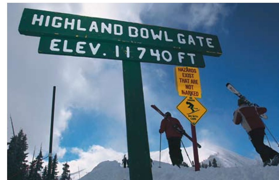
Aufstieg zum Highland Bowl, Après-Ski im Pool der Limelight Lodge.

Das Städtchen Aspen dagegen präsentiert sich als schmuckes Bergdorf, dessen Häuser und Resorts mal an den amerikanischen Western, mal den europäisch-alpenländischen oder oft an einen funktional-modernen Stil angelegt sind. Riesige Hotelbunker sucht man vergebens, das größte und wohl auch beste Haus am Platze, das St. Regis mit seinem Remède Spa und Zimmern mit dem schönsten Blick auf den Hang des Ajax, hat 179 Zimmer und Suiten. Viele Häuser orientieren sich am Boutique-Hotel-Konzept, so das Sky Hotel oder auch die vom Preis-Leistungs-Verhältnis am besten abschneidende Limelight Lodge. Große Zimmer mit Küchenzeile für Selbstversorger, Pool und Whirlpool für einen entspannten Après-Ski und die zentrale Lage