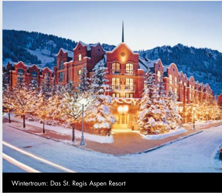
Wintertraum: Das St. Regis Aspen Resort