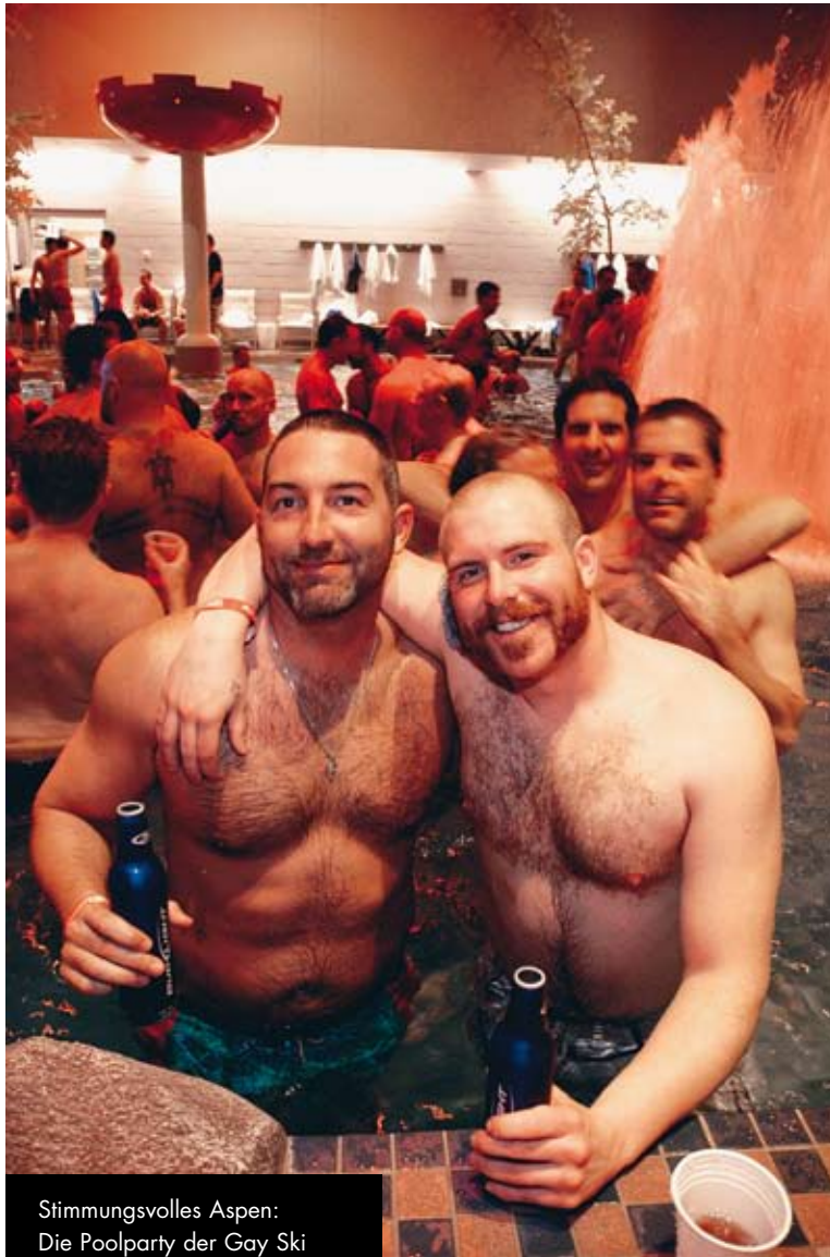
Stimmungsvolles Aspen: Die Poolparty der Gay Ski Week, Feuerwerk am Fuße des Aspen-Mountain.